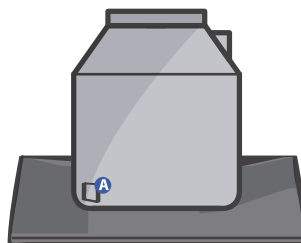
2.000, 2.500 y 3.000 litros